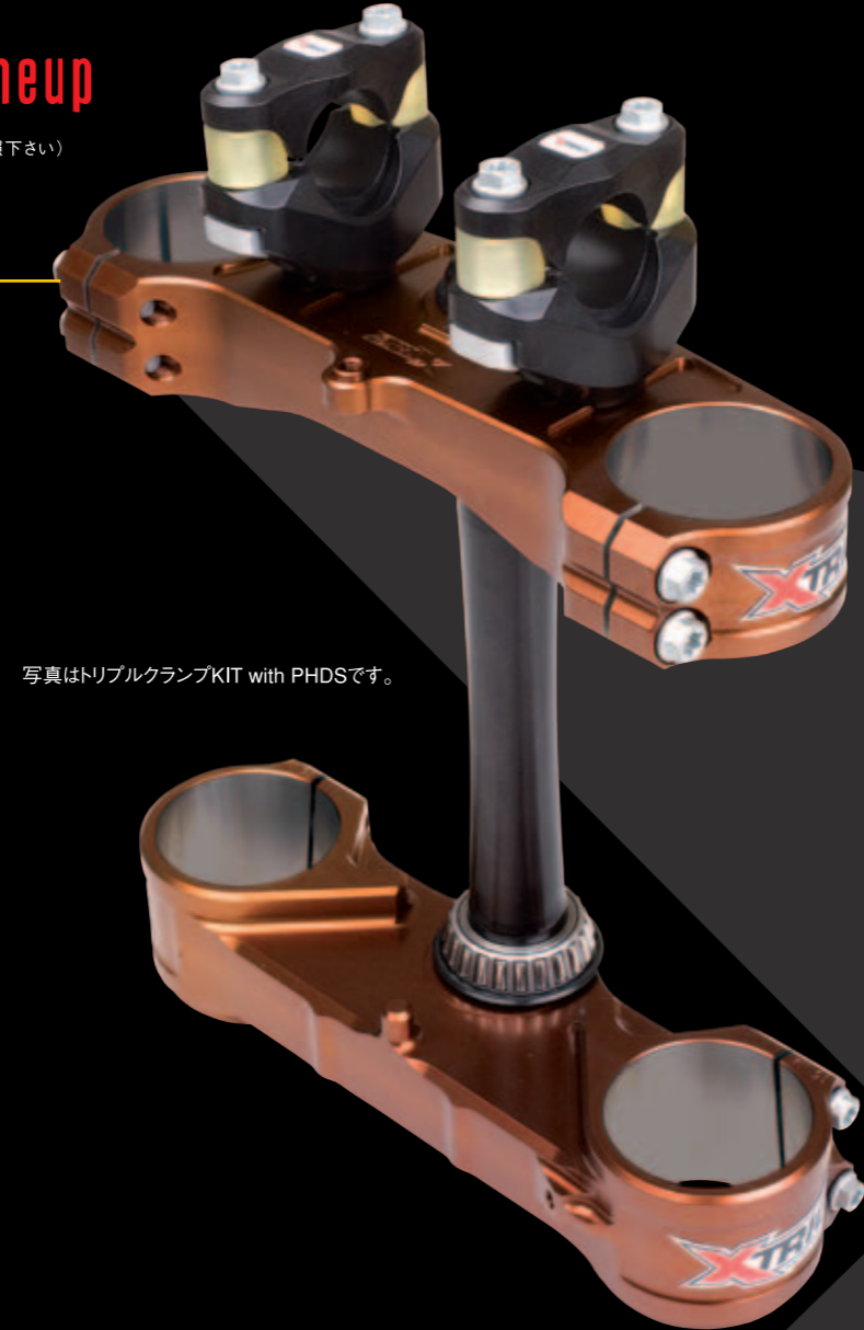
写真はトリプルクランプKIT with PHDSです。