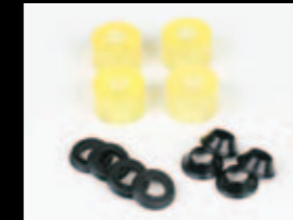
ミディアム(イエロー) ¥2,310 (税抜¥2,200) XT7693