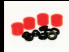
ハード(レッド) ¥2,310 (税抜¥2,200) XT7694

PHDSのダンピング特性を司るエラストマー。XTRIGでは、ソフト、ミディアム、ハードの3種類を用意。ライダーの好みに合わせてチョイスが可能です。(標準設定はミディアムになります。すべてのPHDSに装着可能です。)