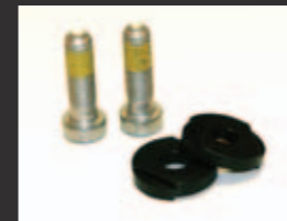
10mm ¥2,835 (税抜¥2,700) XT7696