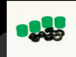
ソフト(グリーン) ¥2,310 (税抜¥2,200) XT7692